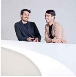
Sou Fujimoto - Architekt